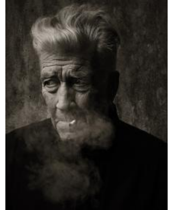
David the TM Guru